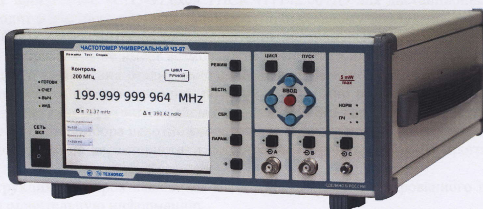
Рисунок 1 - Общий вид частотомера универсального ЧЗ-97