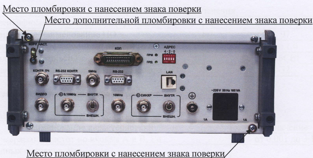
Рисунок 2 - Схема пломбировки от несанкционированного доступа, обозначение мест нанесения знака поверки